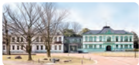
国立工芸館 外観