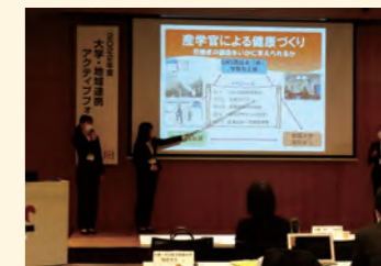
令和4年度アクティブフォーラム

地域課題研究ゼミナール支援事業に採択された県内の高等教育機関のゼミナール、研究室及び学生団体が活動の成果を発表、さらなる地域連携を図るためのフォーラムを開催