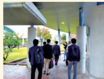
キャンパスツアー

北陸3県以外の高等学校教員を対象に、石川県の学びの環境等を紹介するキャンパスツアーを実施する