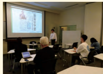
シティカレッジ 授業の様子