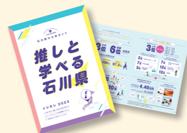
石川県の大学ガイドブック「イシカレ」

石川県の大学ガイドブック「イシカレ」を制作し、県内外の高等学校等に配付 県内の高等教育機関や石川での学びの環境を紹介