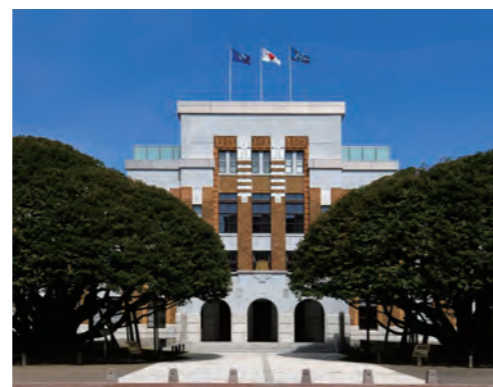
石川県政記念 しいのぎ迎賓館 「公益社団法人 大学コンソーシアム石川」の 事務局は兼六園に隣接する 「石川県政記念 しいのぎ迎賓館」内にあります。