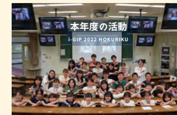
地域課題研究ゼミナール支援事業

高等教育機関と地域団体等が、地域課題の解決及び地域活性化に協働して取り組むことを推進するため、県内の高等教育機関のゼミナール、研究室及び学生団体などを支援〔令和4年度採択件数：14件〕