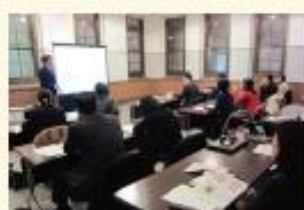
障がい学生支援セミナー