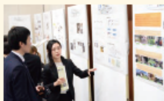
アクティブフォーラム

上記事業の活動報告会「アクティブフォーラム」を平成30年2月金沢市にて開催 県内外から203名が参加