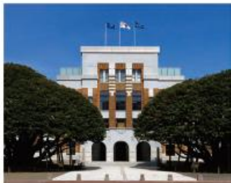
石川県政記念 しいのき迎賓館 「公益社団法人 大学コンソーシアム石川」は兼六園に隣接する「石川県政記念 しいのき迎賓館内」にあり、金沢の歴史や文化ある環境に囲まれています。