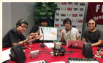
地域課題研究ゼミナール支援事業

地域との連携を強化するため、従来の地域課題研究ゼミナール支援事業及び地域貢献型学生プロジェクト推進事業を統合し、地域共創支援枠及び付加価値強化枠を新設