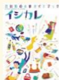
石川の大学ガイドブック2016