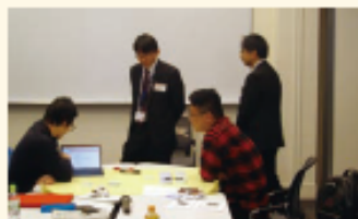
グローバル人材育成支援事業

企業のグローバル化の現状等を高等教育機関の1年生を対象に、若手職員による業務内容等の講義を開催し、人材育成を図る