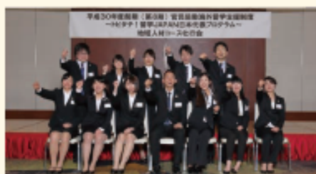
平成30年度前期・社行会

平成28年度前期：7名、後期：9名 平成29年度前期：11名、後期：4名 平成30年度前期：3名