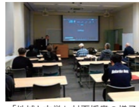
「地域と文学」対面授業の様子