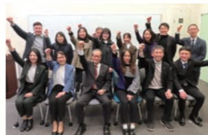
①令和8年度 Take-Off Program 社行会