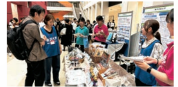
全国大学コンソーシアム協議会研究交流フォーラムでの活動