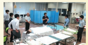
「学都石川」高校教員キャンパスツアー

県内外(対象地域)の高校教員や、北陸3県の高校生・保護者等を対象に、石川県の学びの環境等を紹介するキャンパスツアーを実施