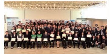
大学・地域連携アクティブフォーラム(成果報告会)

地域課題研究ゼミナール支援事業に採択された高等教育機関のゼミナール等の学生による成果報告会を、地域・大学関係者が参加するフォーラム形式で開催