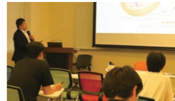
シティカレッジ 講義の様子