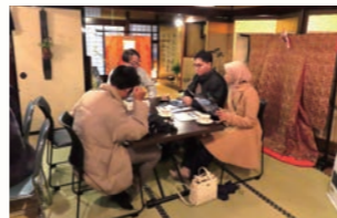
②外国人留学生企業見学バスツアーin小松(瀬戸又)