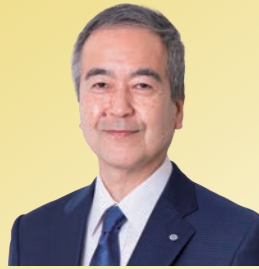
大学コンソーシアム石川 会長