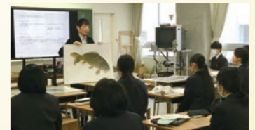
出張オープンキャンパス模擬講義の様子

県内の高等教育機関が連携して、北陸3県の高等学校及び石川県内の中学校へ教員を派遣し大学の模擬講義を実施(令和7年度実績) 実施校 延べ15校 模擬講義実施回数 延べ91回