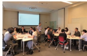
③いしかわグローバルカフェ