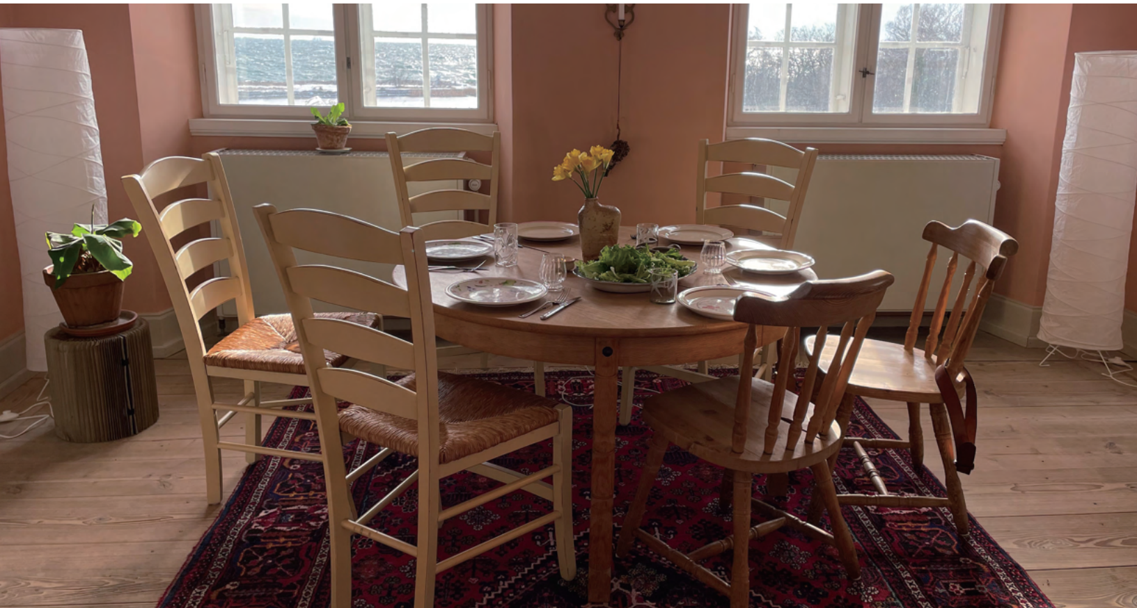
島の最終日に過ごした大切な場所