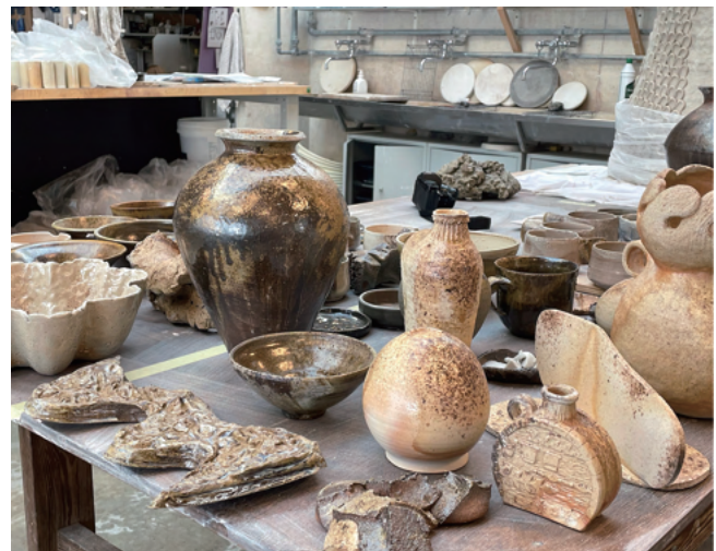
焼成後窯出しをした作品