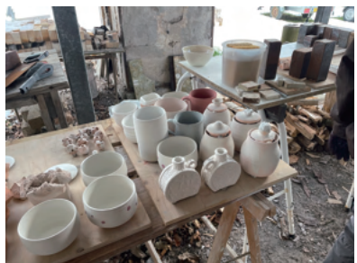
施釉して窯詰め前

作りたての花器をいくつか入れることにした。薪をくべる作業に取り組み、全身煙臭に包まれながら代わりばんこに温度が少しずつ上がるよう窯の番をした。窯出して皆の作品の様々な焼成結果を見合う時間がとても楽しく、しばらく作品から離れられなかった。