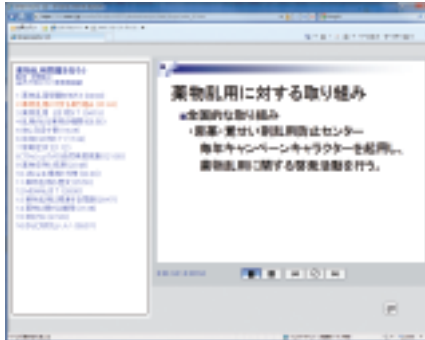
◀「薬物乱用問題を知ろう」の一面画

「大学・社会生活論」の授業で使用している各種ビデオコンテンツは、授業以外にもさまざまな学生向け講習会で使用できます。