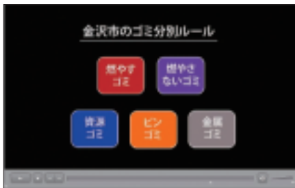
◀「環境問題の基礎(ゴミ問題)」は金 沢市環境局の協力のもとで作成さ れたものです。

「熱中症」は、夏前に運動部の学生▶ リーダーをあつめて講習を行うと 効果的です。