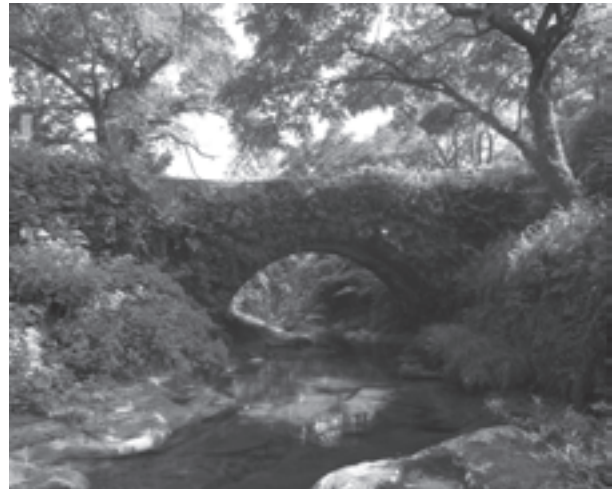
滝ヶ原町の石橋の1つ