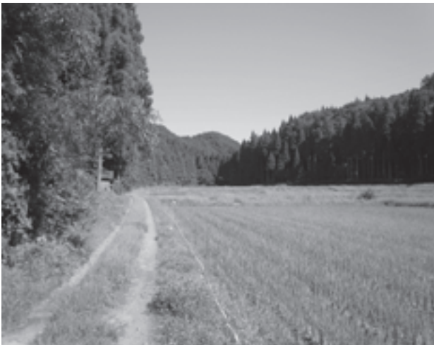
滝ヶ原町の典型的な田園風景

私たちビオトープ研究会は、現地に残る昔ながらの自然景観と生物の保全を目的として、活動しました。地域外の人に来訪してもらえるような美しい景観を発見、撮影してビオトープ研究会のブログで紹介しました。滝ヶ原町に生息する生物の捕獲、同定を行い、標本にして地域でのイベントで発表し、来訪した人に滝ヶ原町に生息する生物に興味を持ってもらい、生物の保全にも関心を持ってもらいたいと思い、活動しました。